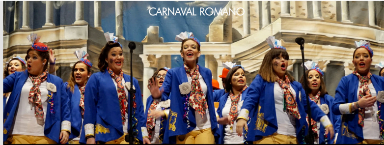
CARNAVAL ROMANO SEMANA SANTA (INTERÉS TURÍSTICO INTERNACIONAL)