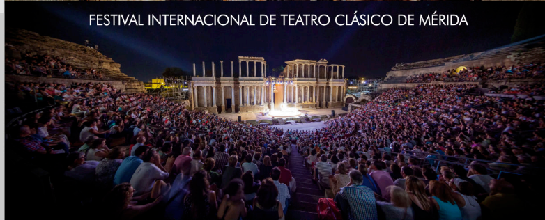
FESTIVAL INTERNACIONAL DE TEATRO CLÁSICO DE MÉRIDA