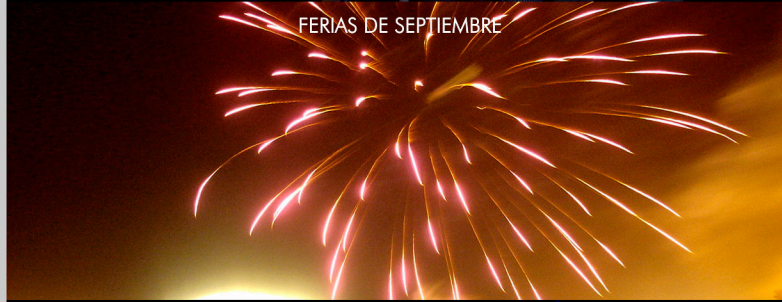
FIERAS DE SEPTIEMBRE